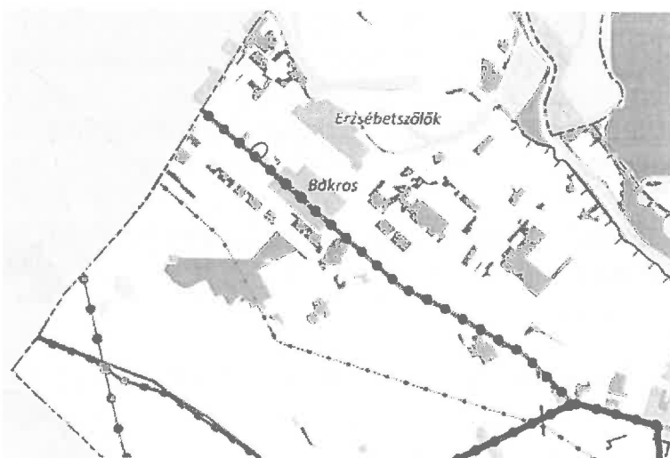
Térségi szerkezeti terv (Jelölés: piros kontúrral a településszerkezeti tervben az újonnan beépítésre szánt terület bemutatása)