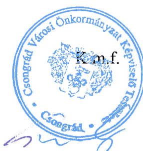
Gyovai Gáspár alpolgármester