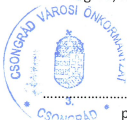
polgármester Csongrád Város Önkormányzata